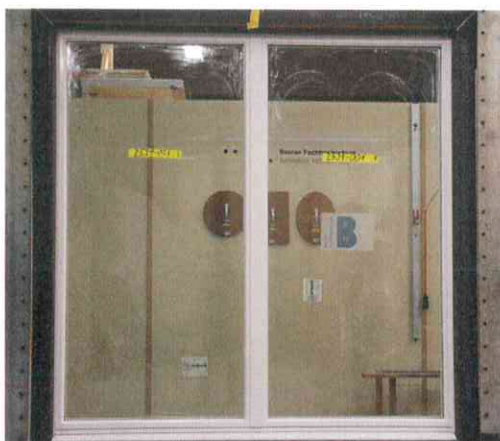
Prüfobjekt Angriffsseite Grösste geprüfte Grösse