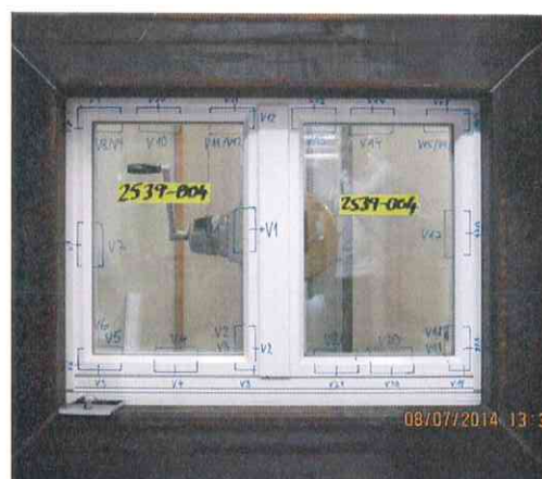
Prüfobjekt Angriffsseite Kleinste geprüfte Grösse